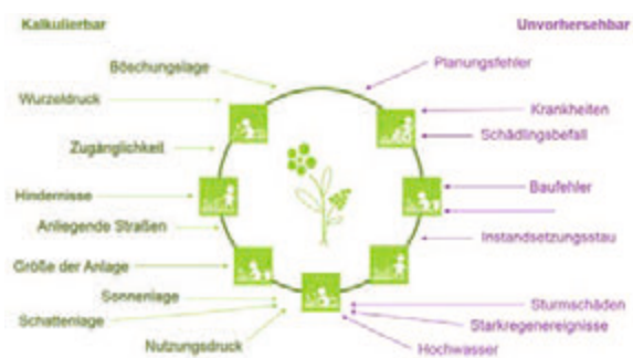
(6) Kostentreibende und kostensenkende Faktoren

Alles beginnt mit der Herstellung bzw. mit dem Einbau des Materials in die Freianlage. Nach der Abnahme beginnt die Fertigstellungspflege. Bei vegetativen Materialien folgt die Entwicklungspflege, in der ein funktionsfähiger Zustand erreicht werden soll. Die längste Lebensphase ist die Erhaltungsphase, die sich bei bestimmten Materialien noch in Reifephase und Alterungsphase gliedern kann. Die Erhaltungsphase ist die lebenszykluskostenprägendste Phase mit allen Leistungen, die für Unterhaltung und ggf. Sanierung des Materials notwendig sind. Der Rückbau eines Materials kann durch Aufwertung des Areals, durch Neuplanung oder Umwidmung erfolgen.