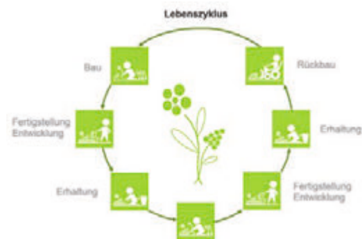
(5) Lebenszykluskosten u. ihre Bestandteile

Die Lebenszykluskosten eines Materials setzen sich aus den anfallenden Kosten in den unterschiedlichen Lebensabschnitten/-phasen zusammen (Bild 5).