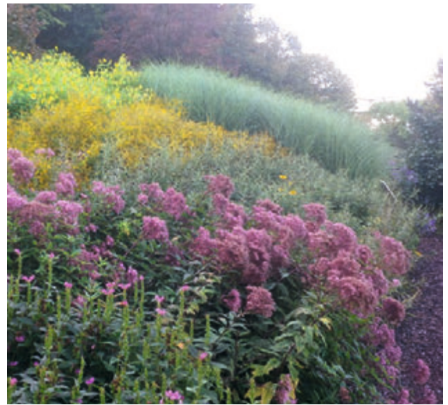
(14) Aspekt der Pflanzung im Spätsommer im Lehr- und Versuchsgarten Braike, Hochschule Nürtingen

thus gracillimus , das relativ großformatige Blattwerk von Rudbeckia triloba oder das dunkelrotbraune Laub von Ageratina altissima 'Chocolate'. In dieser Jahreszeit ist auch die Wirkung der beschriebenen Aspekte durch Texturen, unabhängig von der Blüte, besonders wichtig, dass die verwendeten hohen Stauden wie Solidago -Hybriden und Aster ericoides Sorten, meist erst im Hochsommer oder Herbst blühen. Sie werden abgestimmt auf die Herbstfärbung der Gehölze wie Euonymus alatus 'Compactus', der im Herbst ein Farbfeuerwerk zündet.