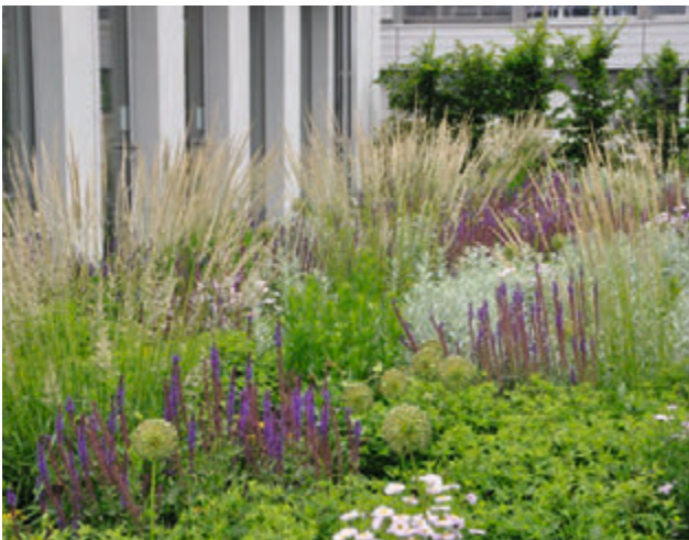
(3) Die Pflanzen vor den Fenstern bieten willkommenen Sichtschutz. Gleichzeitig sollten die Räume nicht zu sehr verschattet werden. (Bild und Planung: © Bettina Jaugstetter)

Die Wahrnehmbarkeit hängt von der Aufwuchshöhe der Pflanzung ab. Wird die Pflanzung vorwiegend von Verkehrsflächen aus wahrgenommen, sollte sie schnell erfassbar und somit nicht zu kleinteilig aufgebaut sein. Bei großen Flächen oder vor fensterlosen Fassaden können gut hohe Stauden eingesetzt werden. Dabei sind allerdings der Regenschatten des Hauses und die einseitige Belichtung zu beachten.