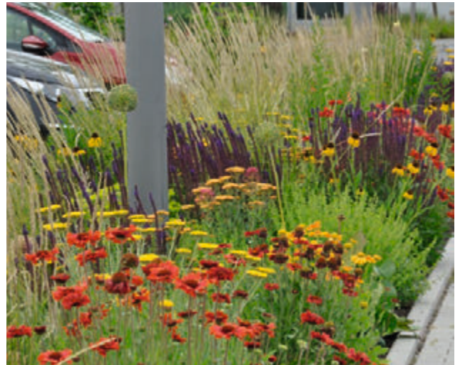
(2) Randbepflanzung eines Parkplatzes. Der Pflanzstreifen hat eine Breite von drei Metern. Hohe Gräser ( Calamagrostis acutiflora 'Karl Foerster') strukturieren die Pflanzung. (Bild und Planung: © Bettina Jaugstetter)

Ein wiesenartiger Gesamteindruck entsteht schon ab etwa dreißig Quadratmetern. Entscheidend dafür sind auch der Anteil an Gräsern und die beabsichtigte Aufwuchshöhe.