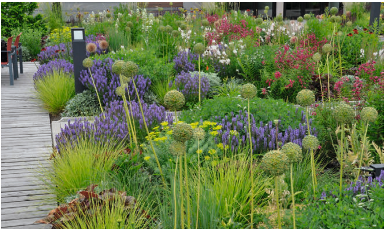
(6) Mischpflanzung am Freisitz einer Kantine im Juli; Sesleria autumnalis (Herbstkopfgas), Salvia nemorosa 'Blauhügel' (Steppenalbei), Penstemon 'Schoenholzeri' (Bartfaden) (Planung und Bild © Bettina Jaugstetter)

Optimal ist ein Gefüge, das in der Lage ist, auf Witterungsschwankungen (trockener Sommer, feuchter Sommer) und kleinere Störungen, wie beispielsweise Verlust einzelner Pflanzen, etwa durch Entnahme oder ungeeignete Artenwahl, zu reagieren, indem Lücken wiederbesiedelt und geschlossen werden. Denn ein hoher Deckungsgrad gepflanzter Arten verhindert durch Lichtkonkurrenz das Aufkeimen unerwünschter Samenunkräuter. Werden die Lücken in den Pflanzflächen nicht durch sich selbst versamernde Arten oder Ausläufer gepflanzter Stauden geschlossen, siedeln sich dort zügig unerwünschte Unkräuter an, die die Pflegezeiten massiv erhöhen können.