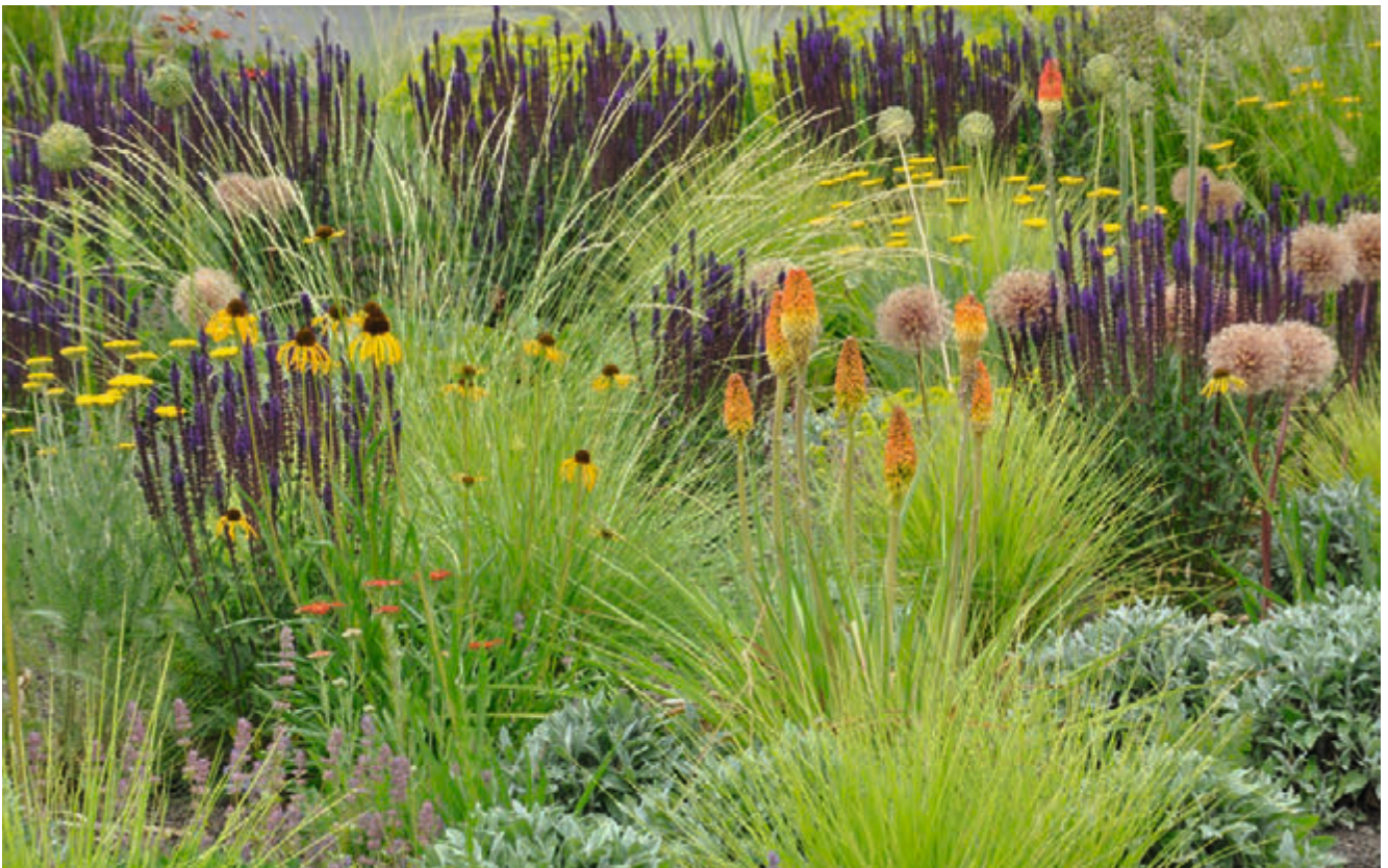
(1) Trockenheitsverträgliche Pflanzung in einem Gewerbepark Anfang Juni, 2. Jahr nach der Pflanzung; Echinacea paradoxa (Gelber Scheinsonnenhut), Festuca mairei (Atlasschwingel) (Planung: Bettina Jaugstetter)