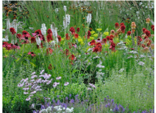
(5) Repräsentative Mischpflanzung in Baden-Baden; Liatris spicata 'Floristan Weiß', Echinacea in Sorten (Planung: B. Jaugstetter)